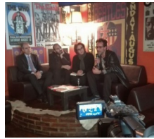
Presentata XIII Rassegna Teatrale RICRII