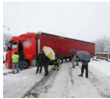
A3: Traffico in tilt. Oliverio: "E' assurdo quanto sta accadendo sulla Sa-RC"