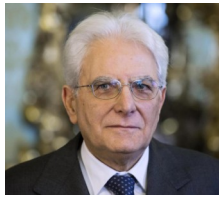
Il Presidente della Repubblica in Calabria